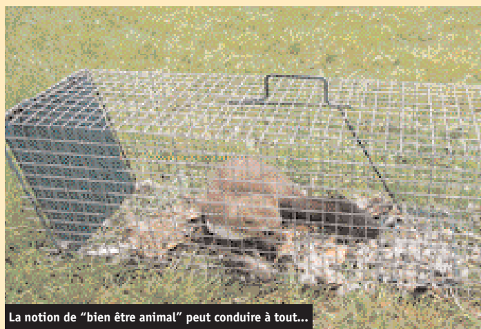
La notion de "bien être animal" peut conduire à tout...

- Obligation de réduction de la "durée maximale avant la perte des réflexes cornéens et palpébraux" (pour les essais des