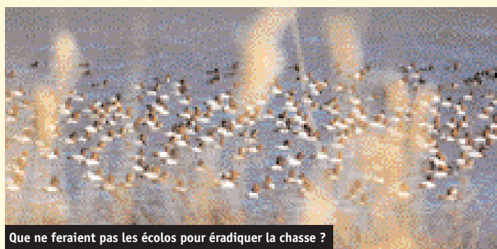
Que ne feraient pas les écolos pour éradiquer la chasse ?

de 2003 à maintenant (soit sur 2 ans) 60 personnes en Asie (qui compte près de 2 milliards d'habitants) ; à comparer avec le virus " normal " de la grippe qui chaque année tue quelques milliers de personnes rien qu'en France, sans provoquer une telle paranoïa et hystérie, notamment chez les écolos ... Replaçons donc les choses à leur place, tout en restant bien sûr vigilants ! ■