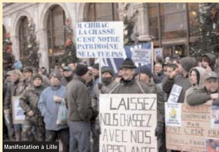
Manifestation à Lille

Le seul problème est cependant de savoir ce que ces décideurs feront de telles études ! En effet, rappelez-vous que pour les dates de chasse, après avoir demandé de telles études, ils n'ont pas hésité un seul instant à les écar-