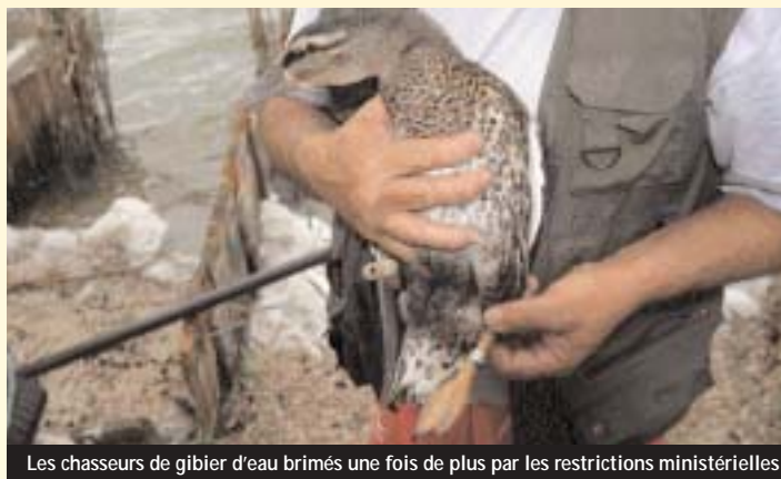
Les chasseurs de gibier d'eau brimés une fois de plus par les restrictions ministérielles

Mais quand cessera t on de négocier à reculons ! ■