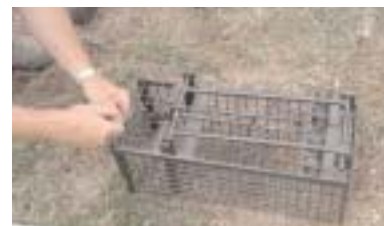
Nuisibles : une décision purement politique

En effet, c'est la première fois que le Président de la FNC avoue, dans un courrier adressé à Nicolas Sarkozy, que l'arrêté ministériel signé par Jean-Louis Borloo retirant la martre et la belette des