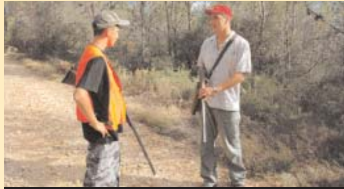
Avec cette loi, les jeunes paieront moins cher pour accéder à la chasse.

CPNT appelait de ses vœux ces nécessaires simplifications administratives sur l'exercice de la chasse que (Schémas de gestion cynégé-